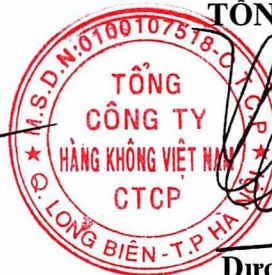
Dương Trí Thành